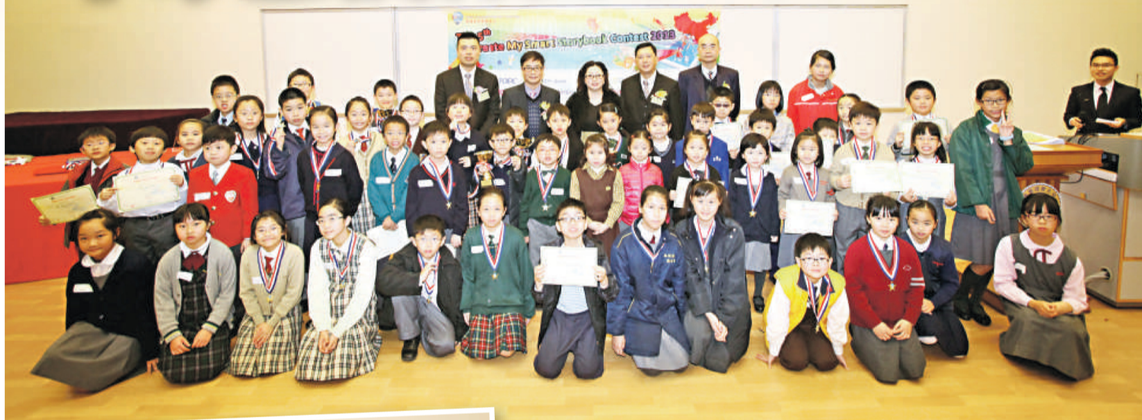
▲60名參加者從7萬多人中脫穎而出，無論最終獲得哪個獎項，能進入決賽已是贏家。