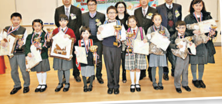
▲各組別的金、銀、銅獎得主都獲得豐富獎品，以示鼓勵。